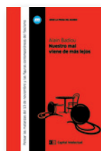
Formato: 12 x 18,5 cm 96 páginas. ISBN: 978-987-614-502-2

La crisis económica, social y política de nuestro tiempo exige una nueva y original crítica de la economía política. En buena medida, se trata de repensar el proyecto de Marx en las condiciones sumamente diferentes del capitalismo del siglo XXI.