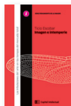
Formato: 12 x 18,5 cm 264 páginas. ISBN: 978-987-614-485-8

Frente a la catástrofe ecológica anunciada, algunos proponen un "pacto ecológico". Este libro discute esa idea. La relación entre el capitalismo y la naturaleza nunca es inmediata. Especulación financiera, racismo y nuevas formas de la guerra forman parte del debate para proponer una nueva ecología política.