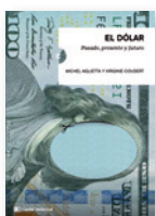
Formato: 14 x 20 cm 176 páginas. ISBN: 978-987-614-489-6

Una historia minuciosa e inédita del organismo más controvertido de la economía global. Desde los debates entre White y Keynes para relanzar la economía mundial hasta sus intervenciones recientes en América Latina y Europa.