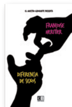
Formato: 12 x 18 cm 96 páginas. ISBN: 978-987-614-499-5

Lo infinito suele provocar miedo, porque la idea del infinito nos recuerda nuestra finitud y la muerte. El ser humano sabe calcular el infinito y a través del pensamiento es el amo del infinito. Por eso, estudiar matemática es tan importante, porque introduce a un verdadero pensamiento del infinito.