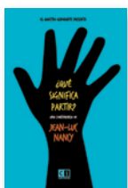
Formato: 12 x 18 cm 64 páginas. ISBN: 978-987-614-503-9

El tema que trata este libro no es sencillo: ¿La diferencia entre los cuerpos supone una diferencia de derechos? La diferencia física entre hombres y mujeres es muy visible ¿pero supone necesariamente una diferencia en las conductas y en la capacidad de hacer cosas?