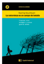
Formato: 15 x 23 cm 200 páginas. ISBN: 978-987-614-498-8