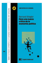
Formato: 12 x 18,5 cm 96 páginas. ISBN: 978-987-614-506-0