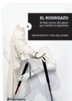
Formato: 14 x 20 cm 128 páginas. ISBN: 978-987-614-500-8