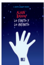
Formato: 12 x 18 cm 64 páginas. ISBN: 978-987-614-497-1

Alain Badiou aborda las matanzas perpetradas el 13 de noviembre de 2015 en París y nos propone elucidar lo que ocurrió. ¿Quiénes son los asesinos? ¿Y cómo calificar su acción? ¿Qué sucede con nuestro mundo desde el punto de vista de lo que se estableció primero insidiosamente, luego de forma evidente y hoy con encarnizamiento?