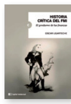
Formato: 14 x 20 cm 160 páginas. ISBN: 978-987-614-507-7

Nunca sabemos qué nos espera cuando se trata de partir. Un lugar desconocido es siempre preocupante. "Partir es morir un poco", pero tenemos muchas razones para pensar que al partir de lo que ya está dado podemos descubrir lo nuevo, cambiar. Cuando alguien no parte, no cambia, no deja nunca sus costumbres, se seca y se vuelve decrepito.